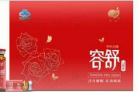
FIGURE 1: Xinjiang Huashidan traditional Chinese medicine product 134

orting partners are in Iran, Tajikistan, Kazakhstan, According to available Xinjiang Huashidan products to Belgium, Kazakhstan, Turkmenistan,